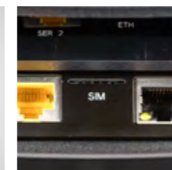
mit Signaturkarten-Slot für die neuen Kassensicherheits-Verordnungen (länderspezifisch)