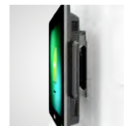
für Tisch- und Wandmontage geeignet (VESA)

Jetzt informieren bei Ihrem Orderman Partner oder unter sales@orderman.com .