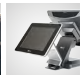
Kundendisplays in verschiedenen Ausführungen (optional)